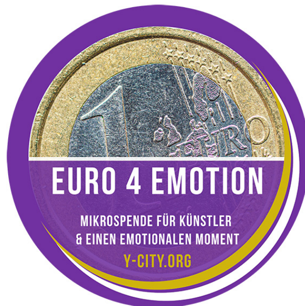
Abbildung 4 - Runder Flyer der Kampagne »EURO 4 EMOTION«

Ein wesentliches Merkmal der Live-Kulturstadt YPSILON ist die tägliche Kunst- und Kultur unmittelbar in der Innenstadt, u.a. unter Nutzung der Bühnen im öffentlichen Raum. Dieses Konzept lässt sich allerdings nur umsetzen, wenn es gelingt, den Kunst- und Kulturschaffenden eine attraktive Finanzierung ihrer Auftritte zu ermöglichen. Der Arbeitskreis empfiehlt, über eine Kommunikationsagentur eine Kampagne entwickeln zu lassen, um die Unterstützung der Straßenkünstler durch Mikrospenden der Passanten abzusichern. So würden auch beispielsweise Studenten der Musikhochschule motiviert, die Straßenkunst als Studentenjob wahrzunehmen und die Innenstadt mit Auftritten zu bereichern. Die Stadt YPSILON folgt der Empfehlung und lässt die Kampagne »EURO 4 EMOTION - Mikrospende für Künstler, die Ihre Emotionen berühren« entwickeln. Die Kampagne vermittelt den Bürgern, dass sie mit jeder Mikrospende einen Künstler, aber auch die Belebung der Innenstadt unterstützen. Entwickelt werden runde Flyer (vgl. Abb. 4), Druckvorlagen für Künstler zum Download sowie T-Shirts für die Künstler.