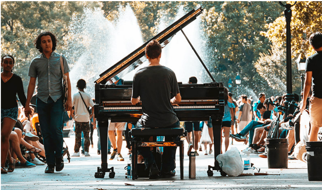
Abbildung 1: Innenstadt als Ort der Begegnung und Kultur.