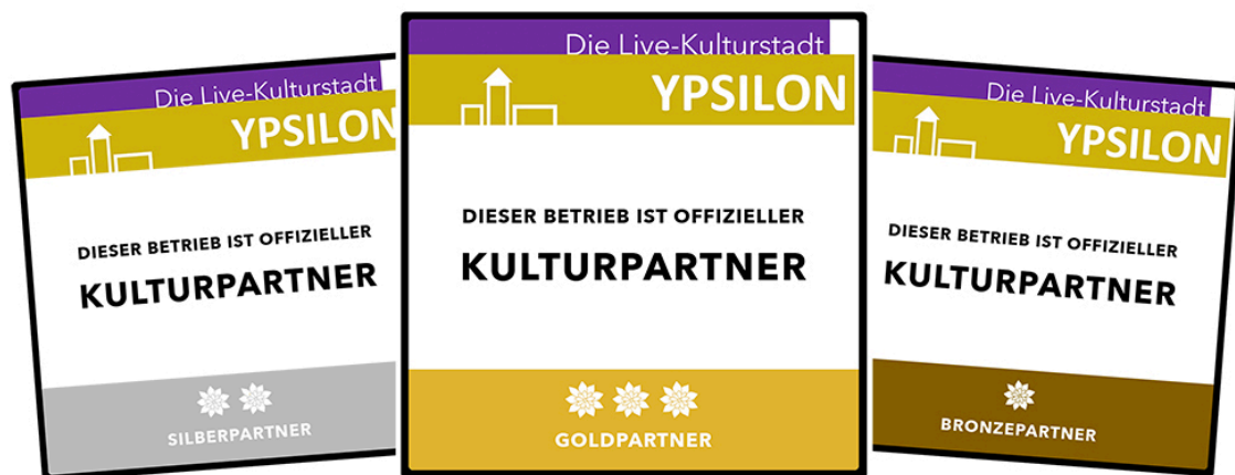
Abbildung 3 - Plaketten für OFFIZIELLE KULTURPARTNER-Betriebe in drei Preiskategorien

KULTURPARTNER-Betriebe vor, die in eine Bronze-, Silber- oder Goldpartnerschaft führen. Die Standardplaketten werden als Aufkleber herausgegeben. Darüber hinaus werden durch einen regionalen Fachbetrieb hochwertige Metallplaketten sowie Edelstahlaufteller angefertigt, die von den OFFIZIELLEN KULTURPARTNER-Betrieben bei einer Verkaufsstelle erworben werden können. Margen sind gemeinwohlorientiert und fließen unmittelbar in das Kulturprojekt ein. Sollte ein Betrieb die Kulturpartnerschaft kündigen, entfällt die Berechtigung zur Nutzung der Plaketten. Die Einführung dieses Finanzierungsmodells wird geplant für die Phase 3, Modul 20.